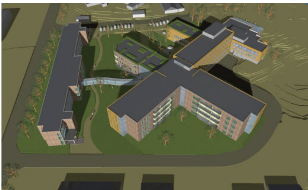
Illustrasjon av samlet bebyggelse sett fra sør-øst. HUS Arkitekter AS.

Det er foreslått en organisering av bebyggelse og funksjoner, basert på en skissestudie som er utarbeidet av HUS arkitekter AS.