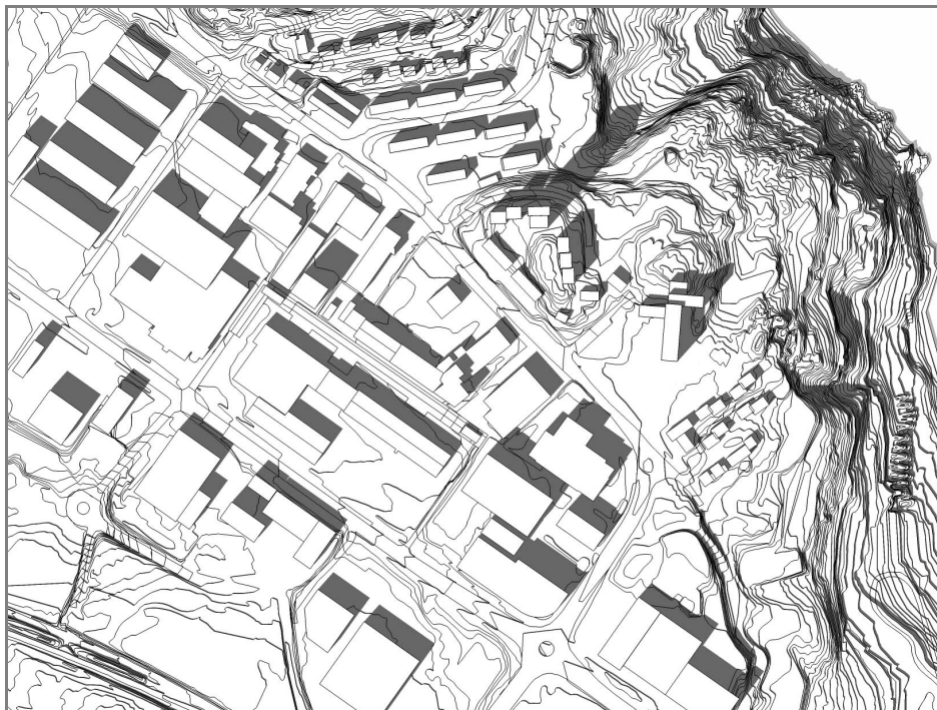
Solstudie av eksisterende strukturer i modell: 21. mars kl. 15:00