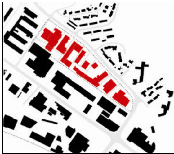
Illustrasjon: Eksisterende bebyggelse i planområdet

Øst for Devle ligger en mindre kolle der det står en 12 etasjer høy boligblokk fra 60- tallet. Blokken er et dominerende element i landskapet. Mellom kollen og Devle ligger et dalsøkk som åpner for utsiktsgløtt fra Ladesletta mot fjorden. Lengst i øst faller terrenget ned mot Leangenbukta og gir utsikt i retning Charlottenlund og Vikåsen.