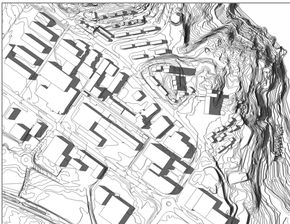
Solstudie av eksisterende strukturer i modell: 21. juni kl. 18:00

Det flate landskapet gir i utgangspunktet gode solforhold gjennom hele året. Området ligger relativt lavt og nær sjøen, slik at temperaturen som regel ligger noen grader høyere enn f.eks. på Byåsen. Den åpne sletta med vide gater er imidlertid eksponert for vind. I kombinasjon med regn eller sludd vil området tidvis kunne oppleves som surt og forblåst. Dominerende vindretning er sørvest.