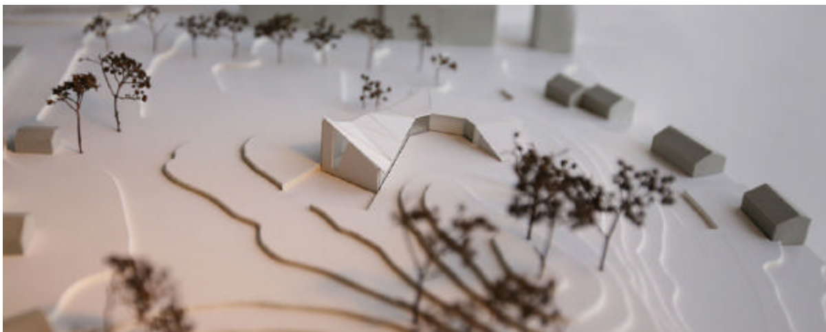
Bygget omkranser kollen. Menighetssalens gavlvegg reiser seg mot sørøst. Byggetrinn 1.