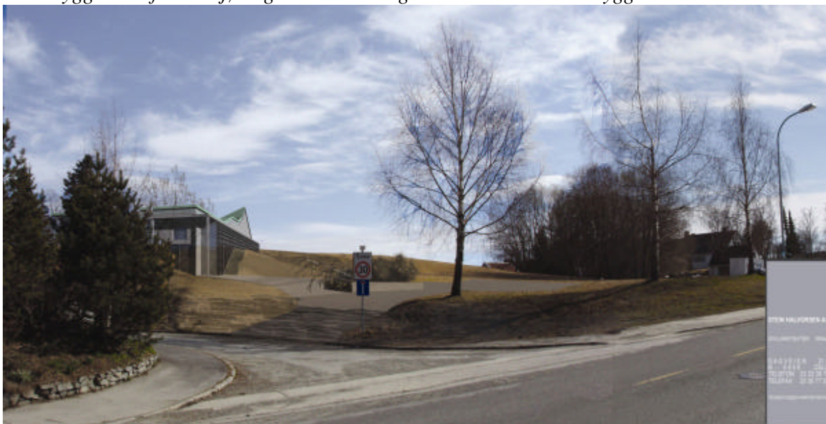
Kirkebygget og atkomstområdet sett fra krysset Gamle Oslovei og Valsetbakken. Full utbygging.