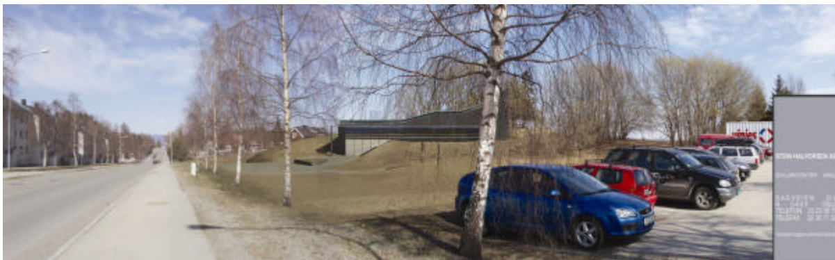
Kirkebygget sett fra innkjøringen til barnehagen i Gamle Oslovei. Byggetrinn 1.