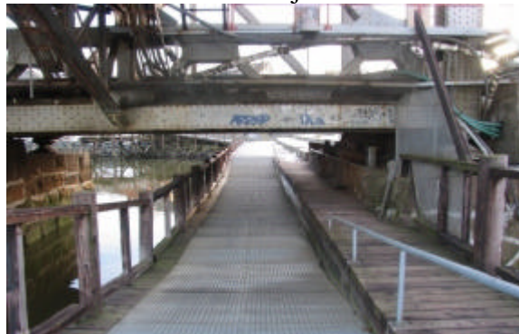
Ill; Eksisterende undergang under vestre del av Skansen jernbanebru.

Undergangen utformes fysisk helt atskilt fra Jernbanebrua og skal ikke berøre bru, brukar eller fundament. Undergangen skal plasseres så langt ut i løpet fra fundamentet til Skansen jernbanebru at den går fri av landkarets fundamentsåle. Den eksisterende serviceplattformen for Jernbaneverket under brua berøres ikke, og kan beholdes som den er i planlagt løsning for undergang. Fri bredde i undergang skal være mellom 2-3 meter og det tillates ramper med stigningsforhold 1:12 med repos.