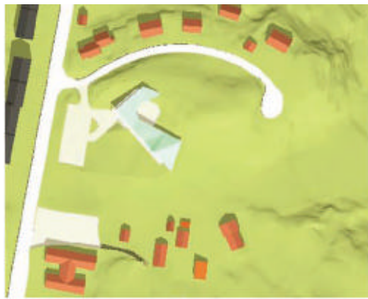
Midtsommer, kl 12.00 Full utbygging

Bebyggelsen like sør for planområdet, tilhørende Gamle Oslovei og Mikkel Mærks vei vil i første rekke bli berørt i forhold til utsyn. De nærmeste bygningene er imidlertid garasje, og bolighusene bak har relativt lukkede fasader mot nord. Store deler av første byggetrinn vil også være skjult bak den tette vegetasjonen ved skiløypa/turstien. Solforholdene på boligtomtene i Mikkel Mærks vei og Gamle Oslovei vil ikke bli endret, da den nye bebyggelsen blir liggende rett i nord. Bolighusene ligger 55-80 m fra kirkebygget i første byggetrinn, mens andre byggetrinn vil ligge om lag 45 m unna.