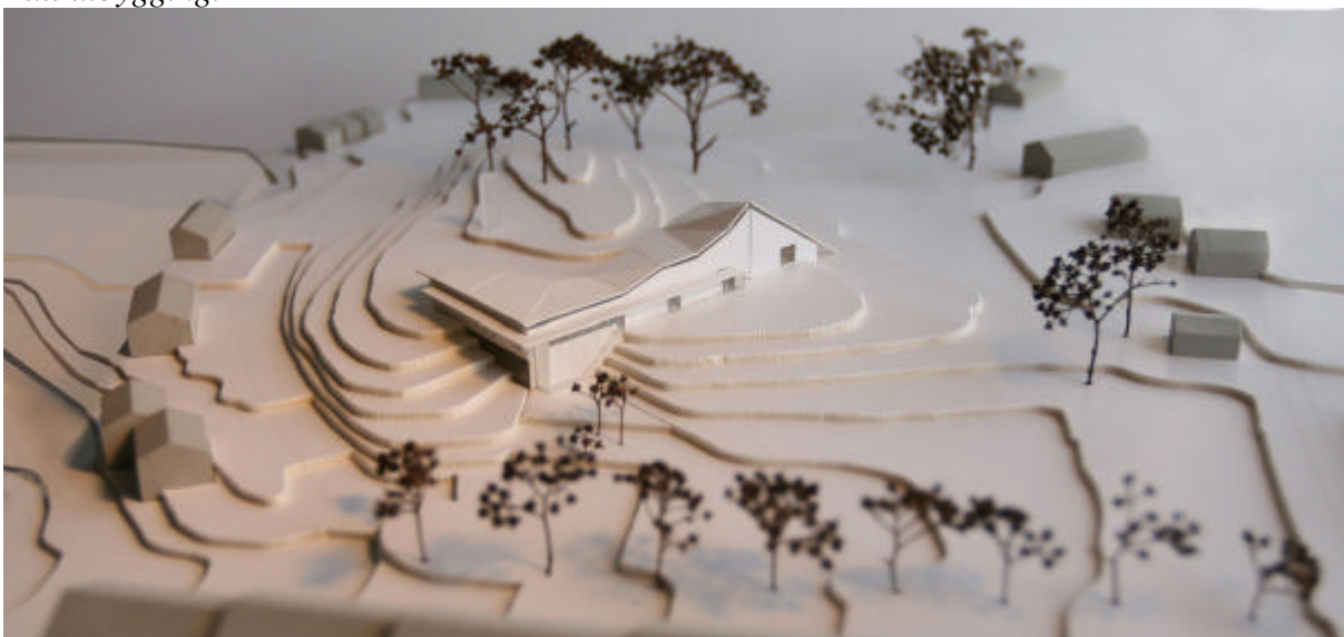
Kirkebygget og atkomstplassen mot Gamle Oslovei. Full utbygging.