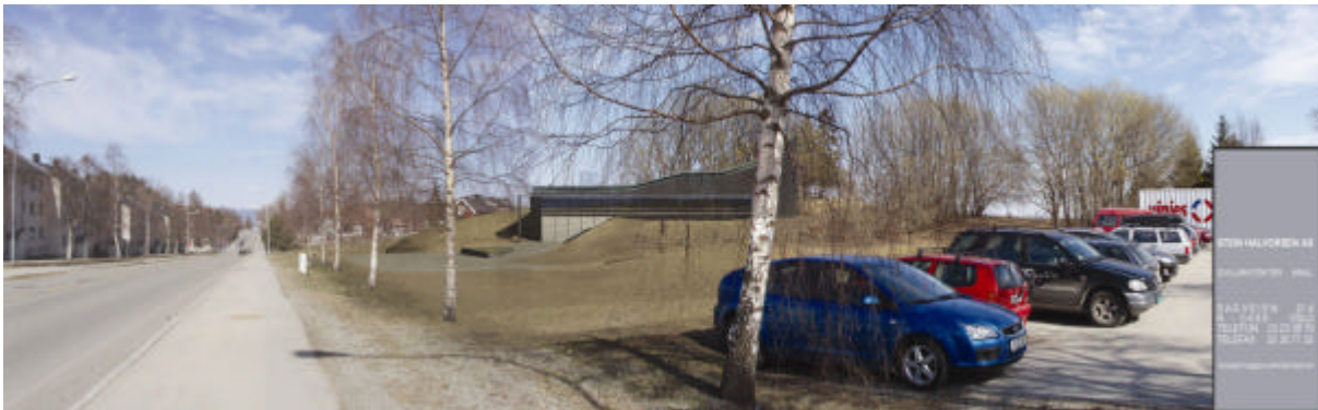
Kirkebygget sett fra innkjøringen til barnehagen i Gamle Oslovei. Byggetrinn 1.