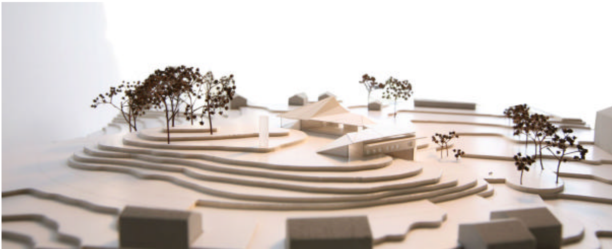
Kirkebygget vender den laveste delen med kontorarealene mot naboene i Valsetsvingen. Full utbygging.