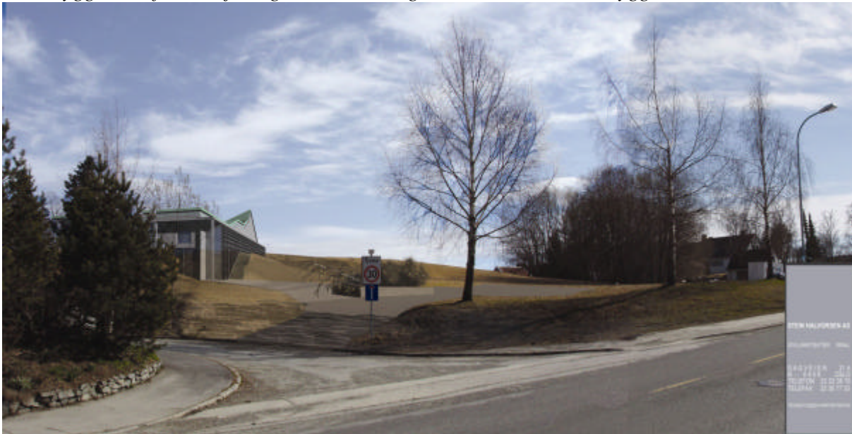
Kirkebygget og atkomstområdet sett fra krysset Gamle Oslovei og Valsetbakken. Full utbygging.