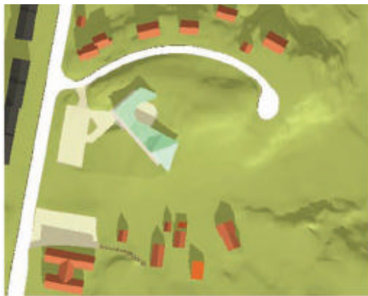
Vår- og høstjevndøgn, kl 12.00 Full utbygging