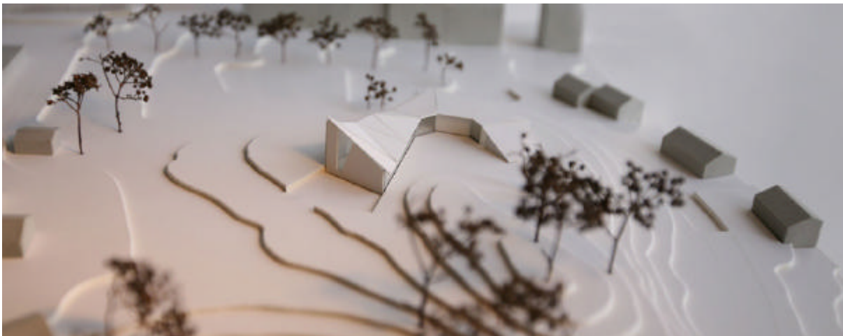
Bygget omkranser kollen. Menighetssalens gavlvegg reiser seg mot sørøst. Byggetrinn 1.