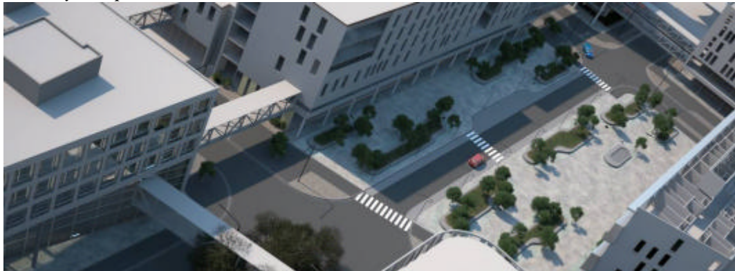
Fig. 3: Illustrasjon av Olav Kyrres plass

Intensjonen med Olav Kyrres plass er å skape en plass med lys og grønt som hovedtema. Utformingen av plassen skal gi et sammenhengende og frodig byrom som er attraktivt både sommer og vinter. Trærne plantes i grupper med oppbrutt rytme slik at de myker opp gaterommet og bidrar til å skape kontrast til de "tunge" bygningsvolumene og den stramme veggeometrien. Veikorridoren er smal og lite dominerende på plassen. Gjennom utforming av gangsoner på plassen, er det ønskelig å lede folk inn på plassen og dermed aktivisere byrommet.