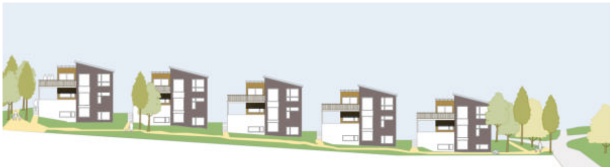
Hustype A fasade mot sørøst

Boligene går over to etasjer, i tillegg til sokkeletasje. Carport, inngang og soverom er planlagt i første etasje, oppholdsrom i andre etasje, og soverom, boder etc. i sokkeletasje. Terrasse med utgang fra stue er planlagt over carport. Nedre terrengnivå mot sørøst nås via utvendig trapp.