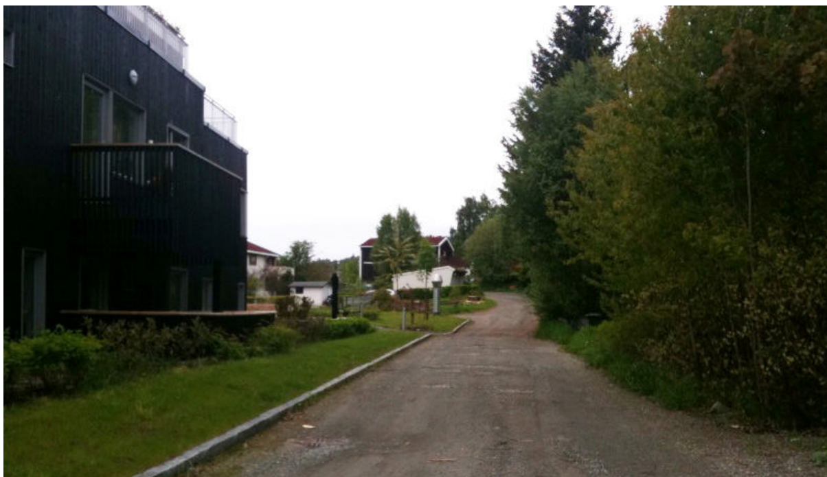
Stikkveg inn på området. Bilde tatt fra avkjøring fra Viktor Baumanns vei

Inn langs området går en privat stikkveg som er atkomstveg for boligene i Byåsveien 124A og B og 126A. Vegen er smal og gruset og er nokså uoversiktlig på grunn av tett vegetasjon langs vegen. Vegen stiger ca 2-2,5 m fra innkjøring fra Viktor Baumanns vei til det innerste huset. Både stikkvegen og terrenget generelt faller mot øst. Høydeforskjellen innenfor planområdet er på 9-10 m. Området har ingen registreringer på kommunens temakart over biologisk mangfold.