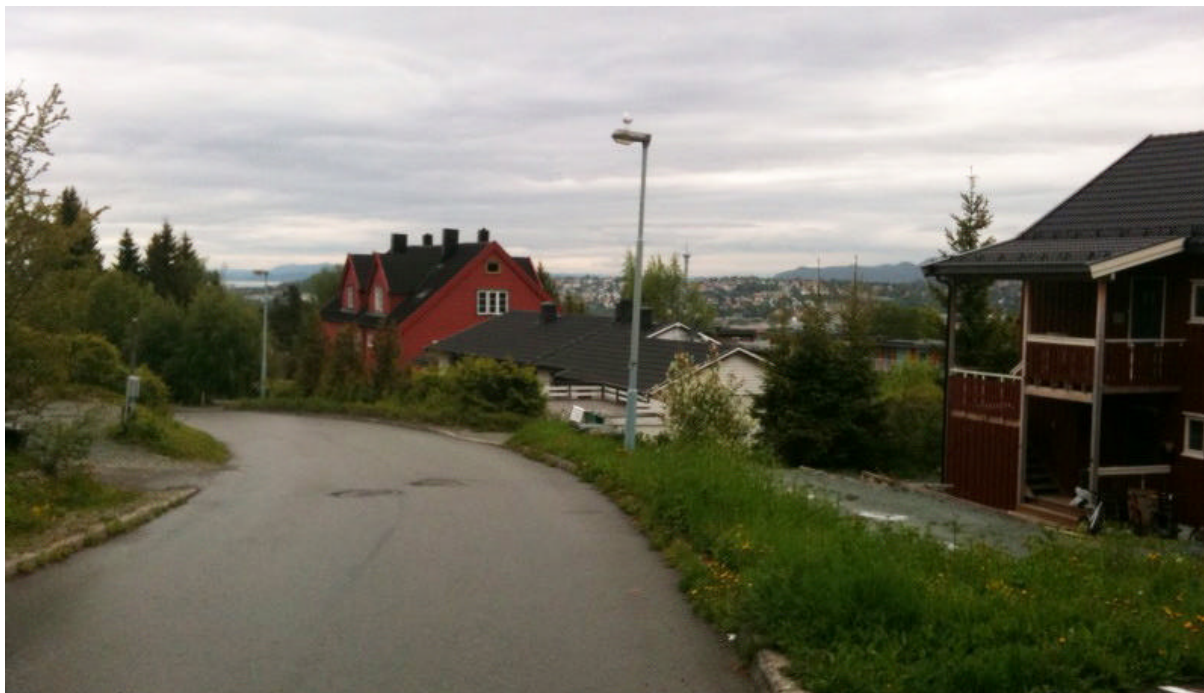
Fin utsikt over Trondheim. Bilde tatt fra områdets vestlige hjørne

Inn langs området går en privat stikkveg som er atkomstveg for boligene i Byåsveien 124A og B og 126A. Vegen er smal og gruset og er nokså uoversiktlig på grunn av tett vegetasjon langs vegen. Vegen stiger ca 2-2,5 m fra innkjøring fra Viktor Baumanns vei til det innerste huset. Både stikkvegen og terrenget generelt faller mot øst. Høydeforskjellen innenfor planområdet er på 9-10 m. Området har ingen registreringer på kommunens temakart over biologisk mangfold.