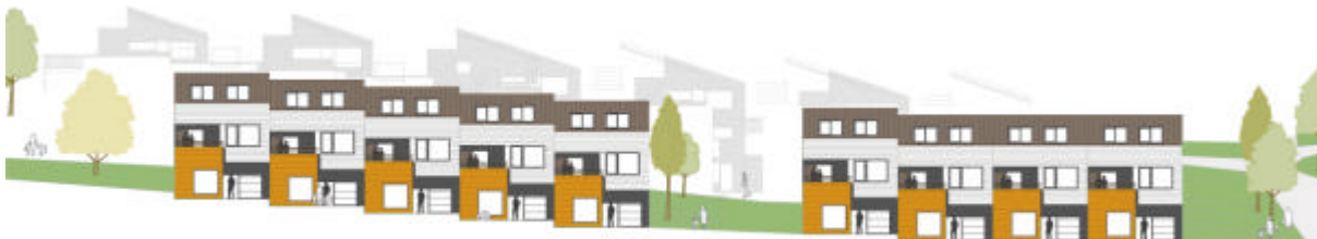
Hustype B fasade mot sørøst

*Arealberegning iht. NS 3940, dvs. inkl. areal i garasje, boder og utvendig overbygd areal mer enn en meter innenfor overliggende takutstikk/balkong.