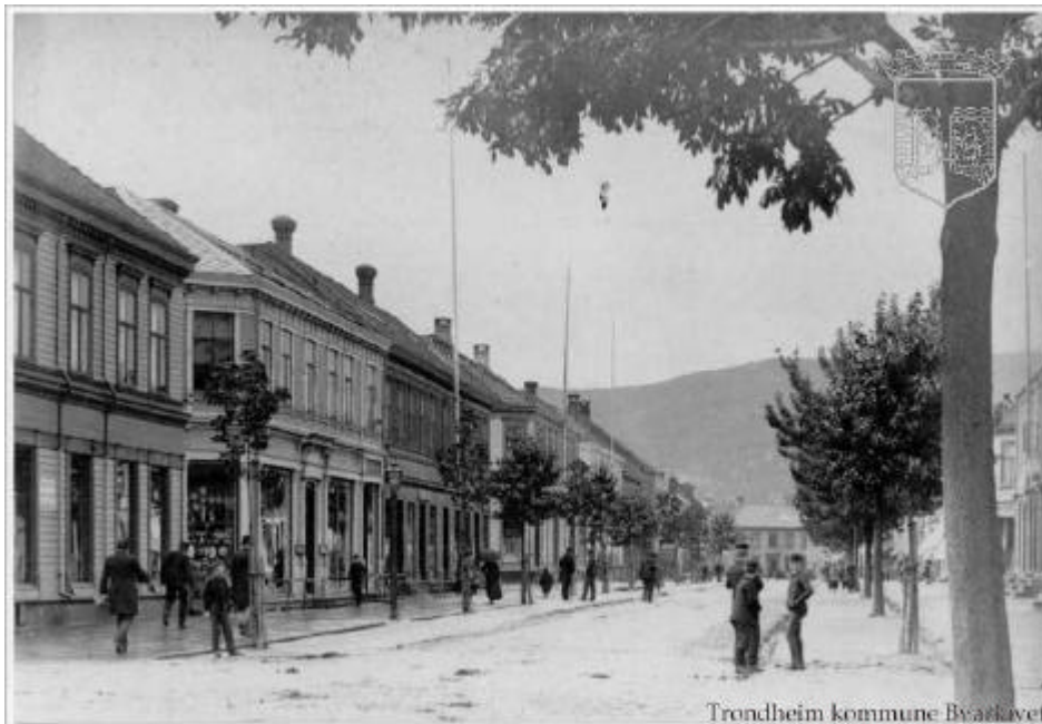
Olav Tryggvasons gate 1893