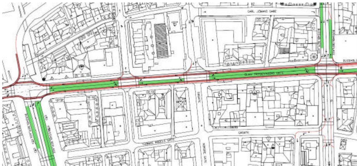
Illustrasjonen viser at det tillates biltrafikk mellom Nordre gate og Jomfrugata (grønt = kollektivfelt, rødt = sykkelfelt)

I gatebruksplanen for Midtbyen er Nordre gate fram til Carl Johans gate og Jomfrugata fram til Fjordgata gågater. Det anbefales å tillate biltrafikk vestover i Olav Tryggvasons gate fra Nordre gate til Jomfrugata for å lette situasjonen for huseiere, varelevering, parkering etc fram til at gågatene bygges ut.