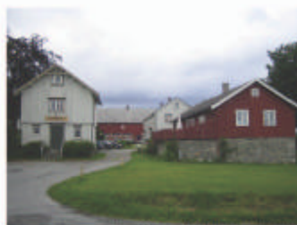
INNKJØRSEL TIL GÅRDSTUNET FRA KIRKEBAKKEN