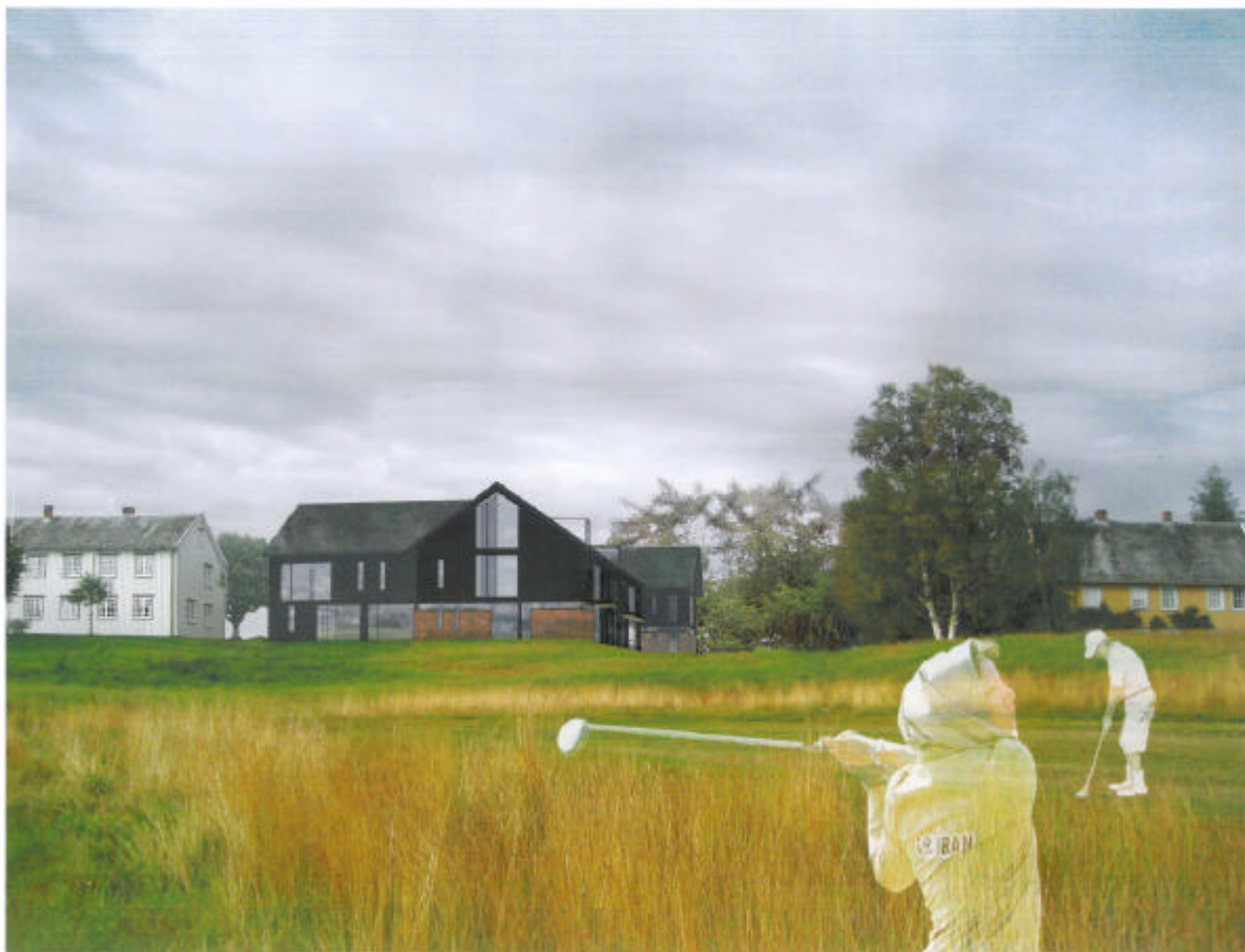
Perspektiv fra nord med ny og gammel bebyggelse på Havstein, og golfbanen i forgrunnen

Reguleringsplanen forventes vedtatt våren 2011. Byggetiltak i B1-E ("låven") er allerede godkjent og ferdigstilt. Byggestart i B2 tilpasses vedtak av reguleringsplan og marked.