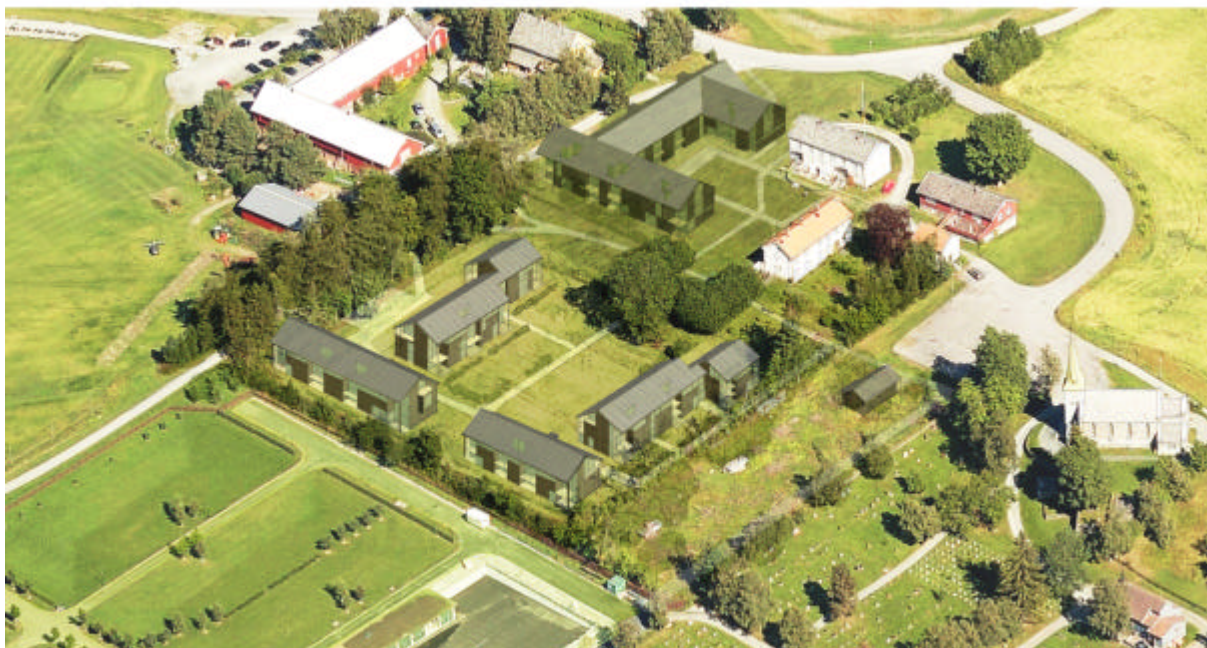
OVERSIKTPERSPEKTIV FRA SØRØST 08.02.2011 EGGEN arkitekter as

Oversiktsperspektiv: hageanlegg, grønnstruktur og ny bebyggelse på Havstein