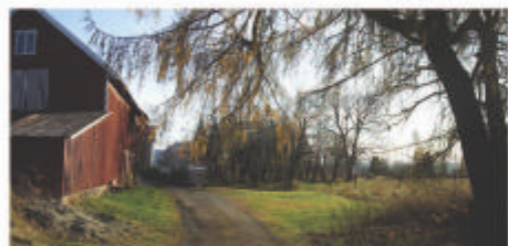
FREM TIDIG GRØNSTRUKTUR SETT FRA VEST