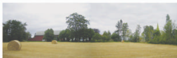
TOMT FOR HAVSTEIN SØNDRE SETT FRA SØR