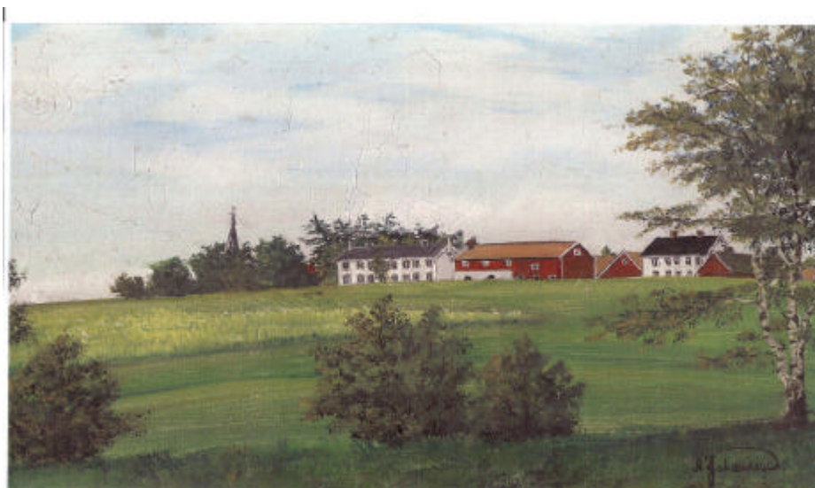
Maleri av Havstein før brannen i 1933

Hovedhuset og størhuset ble bygd opp igjen på grunnmurene av de gamle husene, mens den nye driftsbygningen fikk endret utforming.