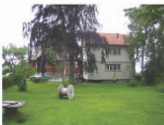
HAGE MELLOM NERSTU OG STABBLØET