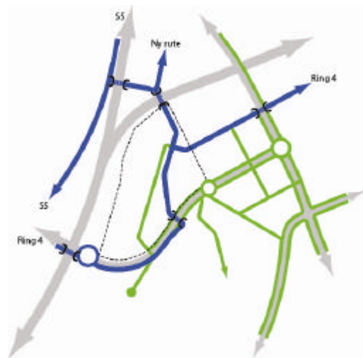
Figur 2. Gang-/sykkelveger