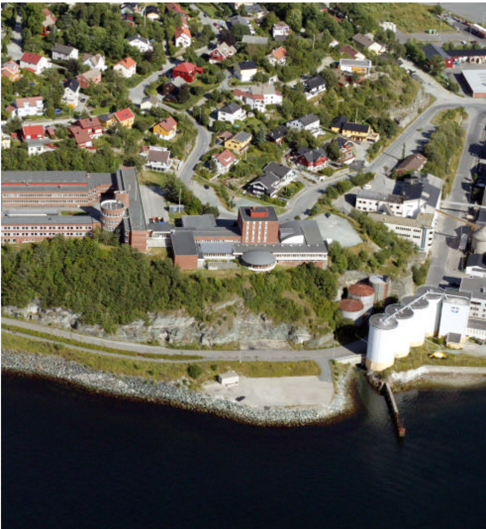
Oversiktsbilde over planområdet

Selve planområdet inneholder ikke bebyggelse. Tilstøtende område mot sør og overforliggende bebyggelse har en struktur og form som bærer preg av store næringsbygg med noen innslag av sirkulære bygninger på Nyhavna. Karakteristiske Lade videregående skole (tidligere kalt kokk- og stuertskolen) kneiser over planområdet som et meget markant byggverk på toppen av Ladehammeren.