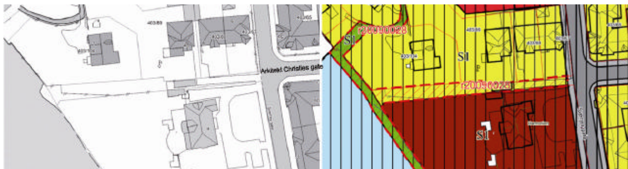
Eksisterende situasjon for området rundt Arkitekt Christies gates allmenning. T.h.: utsnitt av gjeldende reguleringsplan med omriss for nytt planforslag markert med rødt.

Allmenningen i forlengelse av Arkitekt Christies gate benyttes i dag som atkomstveg for boligeiendommene; Sverres gate 4b og Arkitekt Christies gate 8. Det står en garasje på allmenningen, som brukes av Sverres gate 4b. I skråningen og videre ned mot Nidelva brukes allmenningen som hageareal av tilstøtende private eiendommer; Klubbsselskapet Harmonien i sør, Elvegata 1 og Sverres gate 4b nord for allmenningen.