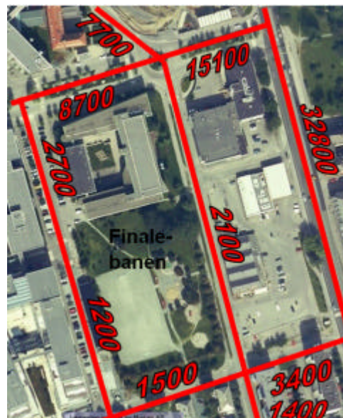
Trafikk år 2010 med tiltaket

Årsdøgnetrafikken i Olav Kyrres gate og Edvard Griegs gate økes begge med 1500 kjøretøy i årsgjennomsnitt. Trafikkøkningen i disse gatene forventes ikke å medføre endrede avviklingsproblemer.