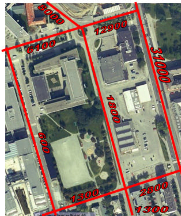
Trafikkbelastning på veinettet omkring planområdet (årsgjennsnitt 2006)

Finalebanen ligger i dag eksponert mot Elgeseter gate, som er hovedinnfartsåre til Midtbyen. Elgeseter gate er sterkt trafikkert med en årsgjennsnitt på over 30 000 kjøretøy. Trafikkmengden og lokalklimatiske forhold gjør at luftforurensning er et problem i parken på enkelt dager. I 2007 var det 41 døgn med grenseoverskridelser for svevestøv (PM10) i gaten. Den gjennomsnittlige verdien for hele 2007 var imidlertid under grenseverdien. Antall døgn med grenseoverskridelser var i 2007 det laveste som er registrert siden målingene begynte. Registreringer viser også at grenseverdien for årsgjennomsnittet for NO 2 i Elgeseter gate ble overskredet i 2007. Forurensningen spres til parken. Trafikkbelastningen (ÅDT 2006) på vegnettet rundt Finalebanen er vist på figuren under.