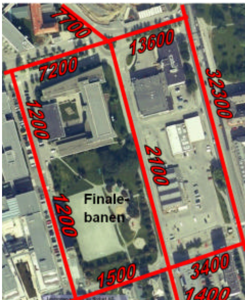
Trafikk år 2010 uten tiltaket

Beregningene viser at tiltaket vil gi en økt trafikkbelastning i Elgeseter gate på ca 500 kjøretøy i årsgjennomsnitt. Denne økningen er vurdert som liten, sett i forhold til at Elgeseter gate i dag har en trafikk på over 30 000 kjøretøy. Det forventes derfor at trafikksituasjonen på hovedvegnettet i liten grad påvirkes av tiltaket. Siden kapasiteten på hovedvegnettet, spesielt i kryssene, allerede er overskredet deler av døgnet, må det forventes en viss økning i kødannelse i rushtiden, spesielt i ettermiddagsrushet.