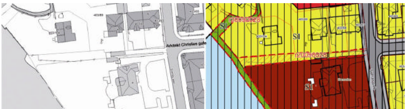
Eksisterende situasjon for området rundt Arkitekt Christies gates allmenning. T.h.: utsnitt av gjeldende reguleringsplan med omriss for nytt planforslag markert med rødt.

Allmenningen i forlengelse av Arkitekt Christies gate benyttes i dag som atkomstveg for boligeiendommene; Sverres gate 4b og Arkitekt Christies gate 8. Det står en garasje på allmenningen, som brukes av Sverres gate 4b. I skråningen og videre ned mot Nidelva brukes allmenningen som hageareal av tilstøtende private eiendommer; Klubbsselskapet Harmonien i sør, Elvegata 1 og Sverres gate 4b nord for allmenningen.